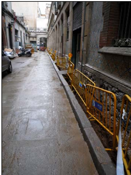
FOTO 3. Rasa del Passatge del Patriarca oberta.