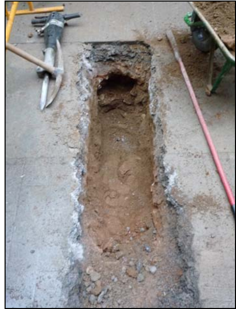
FOTO 6. Primer encreuament al Passatge del Patriarca núm. 6-10.