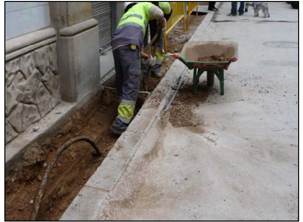
FOTO 2. Rebaixos del Passatge del Patriarca.