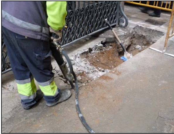
FOTO 1. Obertura del Passatge del Patriarca.