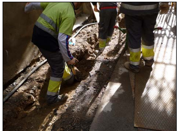
FOTO 4. Rebaixos al Carrer Espolasacs.