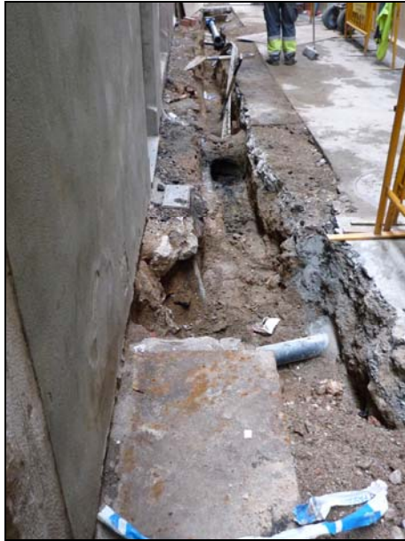
FOTO 5. Rasa del Carrer Espolsasacs oberta.