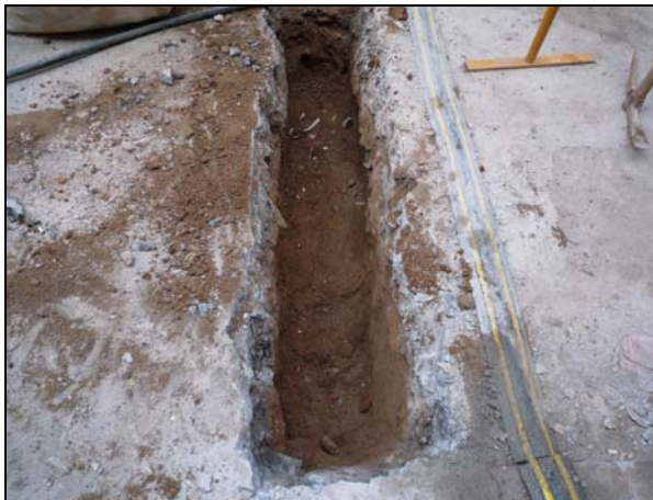
FOTO 7. Segon encreuament al Passatge del Patriarca núm. 6-10.